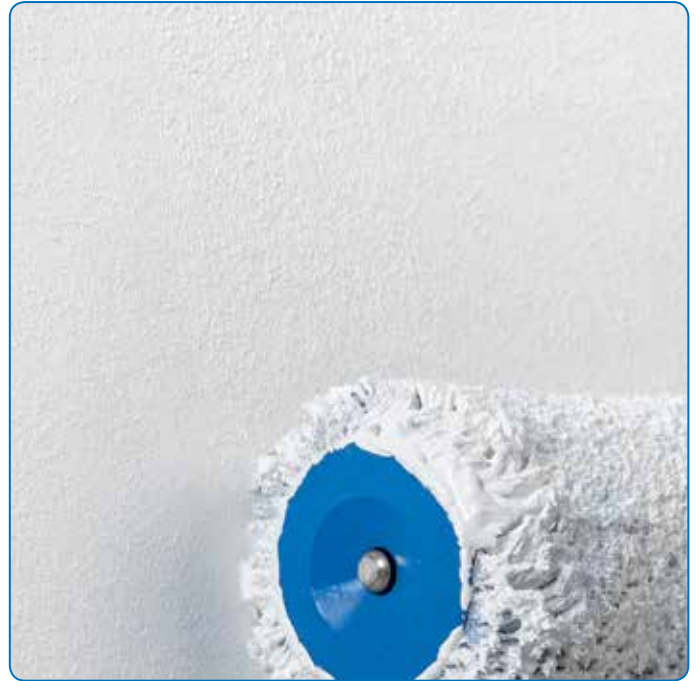
Optimal geeignet zur Beschichtung glatter Untergründe mit feinstem Oberflächen-Finish.