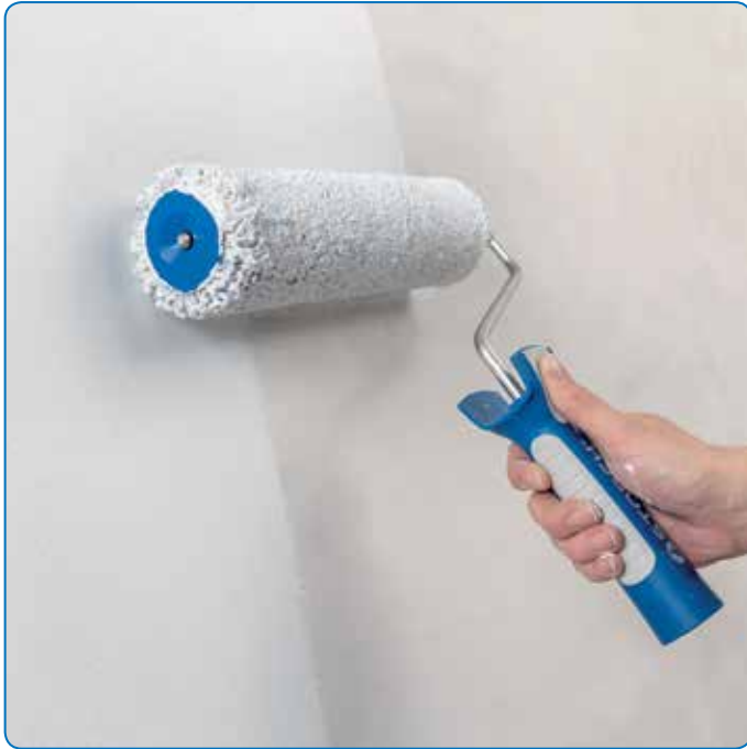
Effiziente und streifenfreie Beschichtung, auch auf größeren Flächen.